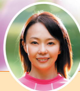
ゲストランナー 千葉真子さん

1976年京都府宇治市生まれ。旭化成に入社し、96年アトランタ五輪1万メートルで5位入賞、97年アテネ世界選手権1万メートルでトラック初となる銅メダル獲得など、日本女子長距離界のトップ選手として国際舞台で活躍。チバちゃんの愛称で多くのファンに親しまれる。旭化成退社後は豊田自動織機に所属。小出義雄氏の指導を受け、03年パリ世界選手権マラソンで銅メダルに輝き、世界で初めてトラック、マラソン両方のメダルを手にした。2005年2月からは、競技人生の集大成として小出監督のもとを離れ、自らの考えと計画のもとでマラソンに挑戦した。2006年8月27日「2006北海道マラソン」を最後に「頑張るマラソン」の第一線からは引く決意を表明。現在はマラソン大会のゲストランナーや講演会、メディアなどで活躍し、「スポーツで世の中を元気にしたい」という目標に挑戦中。